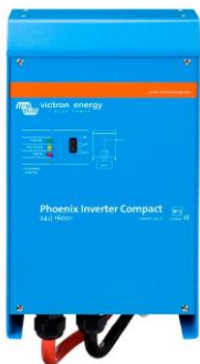
Wechselrichter Compact 24/1600

Diese größeren Wechselrichter-Modelle sind mit einem VE.Bus-Anschluss ausgestattet. Alles, was Sie zum Anschluss an Ihren PC benötigen, ist unsere MK3-USB VE.Bus-zu-USB-Schnittstelle (siehe unter Zubehör). Zusammen mit unserer Software VictronConnect oder VEConfigure, die kostenlos von unserer Website heruntergeladen werden kann, können die Parameter der Wechselrichter kundenspezifisch eingestellt werden. Dazu gehören Ausgangsspannung und -frequenz, Über- und Unterspannungseinstellungen und die Programmierung des Relais. Dieses Relais kann z.B. zur Signalisierung mehrerer Alarmzustände oder zum Starten eines Generators verwendet werden. Die Wechselrichter können auch an ein GX-Gerät (z.B. Cerbo GX) zur Überwachung und Steuerung angeschlossen werden.